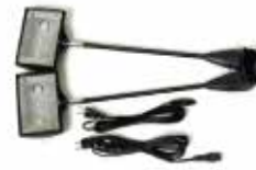
スポットライト (電源コード、コネクター含む)